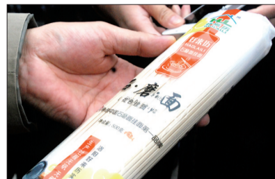
好来历石磨面挂面成品

快速干燥法等其他烘干技术,好来历石磨面挂面采用的是低温脱水技术,虽说要多走大概460米的“路”,损耗15%的成品,但更好地保留了挂面的营养成分。