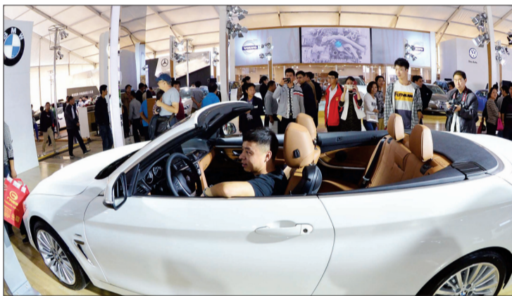
敞篷宝马，您想不想试一把？

昨日，由洛阳日报报业集团主办，为期3天的2014中国洛阳秋季精品房展会在王城公园开幕，吸引了不少市民前去观展。