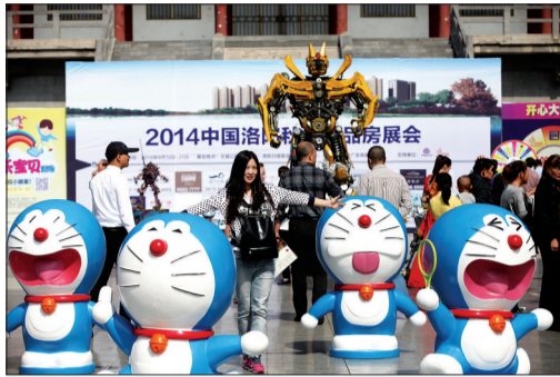
房展会上，还能遇见机器猫