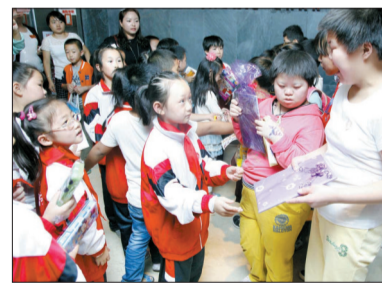
爱心家庭的孩子们给福利院的朋友带了许多礼物