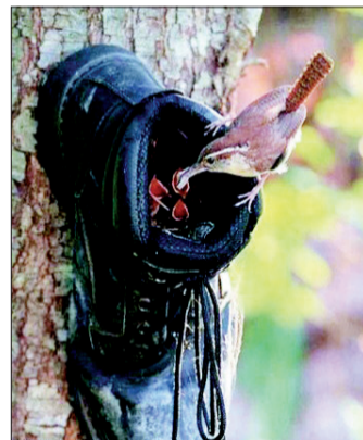
这树上的鸟巢真奇妙