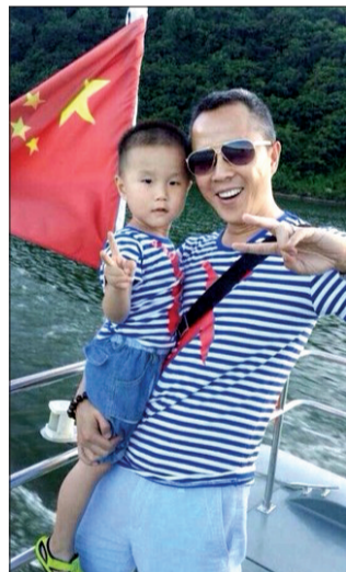
(本文图片均为资料图片)