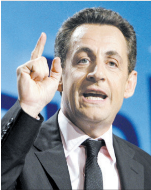
尼古拉·萨科齐

萨科齐现年59岁,2007年至2012年任法国总统。他2012年在总统选举中败给奥朗德后,宣布退出政坛。沉寂多日后,萨科齐19日在博客网站“脸谱”和“推特”上宣布复出,称将于今年11月角逐法国人民运动联盟主席一职。