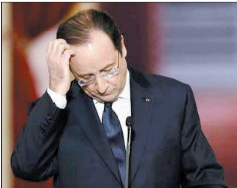
弗朗索瓦·奥朗德