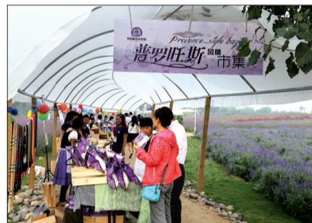
文化节上的普罗旺斯风情市集

本周六,庄园将会举行纯正的洛阳唯一的法式婚礼秀。十一黄金周庄园还会举办一系列的活动迎接游客。