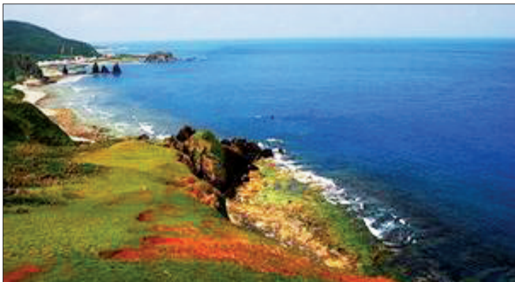
台湾风光 (资料图片)

乘高铁出游的时间与飞机相当,但要比普通火车和飞机舒适得多,宽敞明亮、现代化的车厢和座位使您可随意走动聊天、观赏窗外美景。高铁台湾环岛游,一价全包,只需4380元,从洛阳乘车当天到达福州,休息一晚,第二天乘快船穿越台湾海峡(大约2.5小时),开始您7天的台湾环岛之旅,饱览台湾精华景点台北故宫、101大厦、日月潭、阿里山、垦丁……乘坐高铁专列与双飞环岛游相比要节省1000多元的费用,而精华景点一个不少,性价比高,与普通的台湾环岛游相比要便宜1000多元。