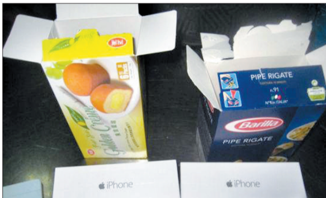
▲ 在茶叶盒中藏匿的 iPhone 6