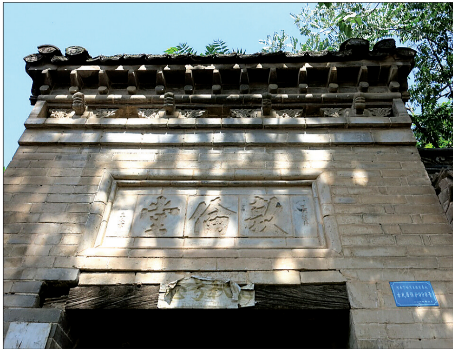
◀王家大院西院的敦伦堂