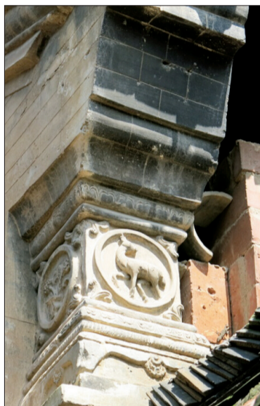
▲王家大院的精美砖雕