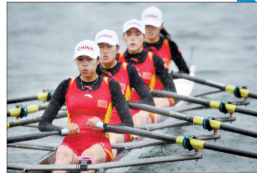
中国队获得女子轻量级4人双桨冠军