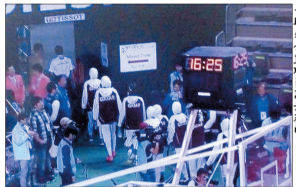
卡塔尔女篮球员离开赛场