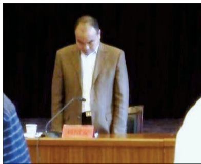
昆明市教育局局长刘绍安向遇难者默哀

据了解,截至目前,伤亡学生人数共32人,其中死亡6人,在医院治疗26人。在治伤员中,2人伤情较重,目前生命体征平稳,其中1人已明显好转,其余伤员病情平稳,截至目前已出院4人。