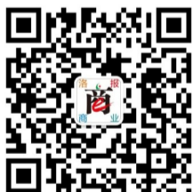
洛报商业微信二维码