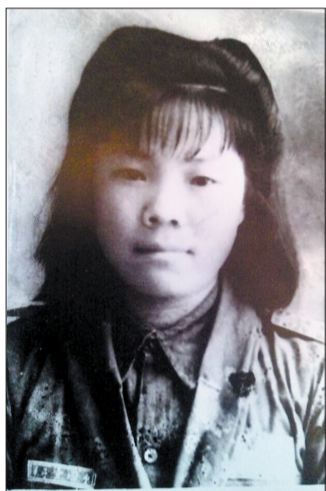
少年史淑玲完小毕业照(翻拍)

1905年,清政府废除科举制,民间私塾逐步向近代学堂过渡。除了国文,改良私塾还增设算术、体操、游戏等课程,然而在学生性别比例方面,几乎没有改变,改良私塾里的女学生依旧少得可怜。