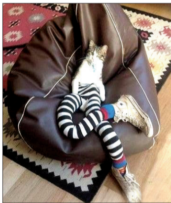
主人,你这是搞哪样?