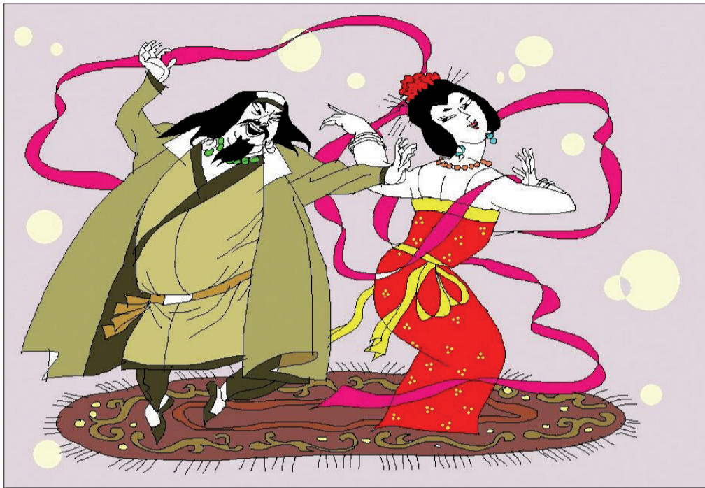
安禄山与杨玉环跳胡旋舞 李玉明插图

胡旋舞的表演戛然而止,唐玄宗带上杨玉环仓皇西逃,杨玉环最终命丧马嵬坡,安禄山失去了他最好的胡旋舞搭档,不知他得知杨玉环的死讯后有何感想。