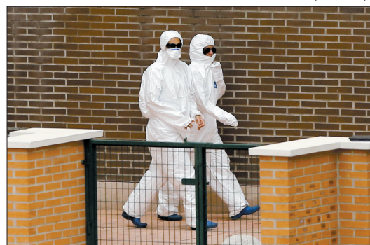
身着防护服的医护人员