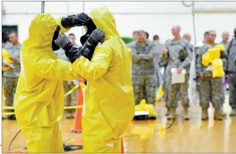
美国士兵在训练,他们将前往西非抗击埃博拉疫情(资料图片)

虽然国际社会伸出援手,但埃博拉疫情仍在西非三国无情肆虐。究其原因,一名美国顶尖科学家10月18日宣称,部分在于病毒发生变异、传染性更强。英国考虑派出3000名士兵前往疫区塞拉利昂,协助当地实施军事封锁防止疫情蔓延。