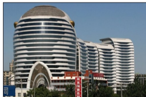
北京林达海逸广场