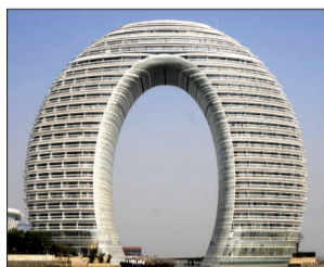
浙江湖州喜来登温泉度假酒店

■ 短命 近日，广州市耗资8亿元建成的陈家祠广场，仅使用4年时间，即因为城市建设需要“推倒重来”。类似的短命建筑正在各地不断出现。