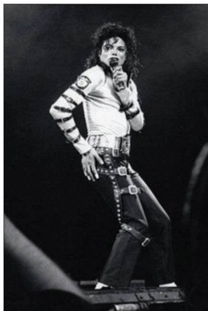
迈克尔·杰克逊

入迈克尔·杰克逊的太空步等几个著名动作。何塞说,他这么做是为了让人们在堵车时多些乐趣,保持好心情。不过,何塞可能没想到,自己变成了一道风景,还有路人主动提出跟他合影。