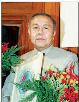
泰国学者素拉·西瓦拉克 (资料图片)