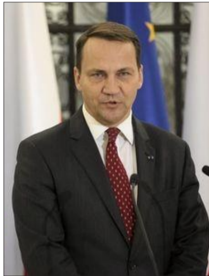
波兰前外长西科尔斯基 (资料图片)

俄罗斯总统普京发言人比斯科夫21日表示,该杂志针对“普京向波兰提议瓜分乌克兰”的报道十分荒谬,其目的在于转移注意力。