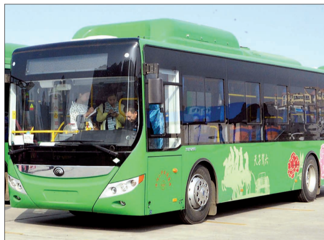
新能源自动挡公交车即将“上岗”