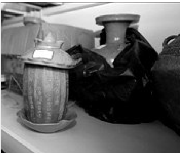
以上图片内容为起获的部分文物（网络图片）