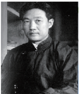
徐悲鸿: 新中国美术奠基人、中央美术学院第一任院长、近代美术宗师、画马第一人,单幅画作《九州无事乐耕耘》拍到2.668亿元。