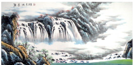
雷甲宝: 李可染嫡传弟子亲绘《源远流长·山水图》真迹,规格8平尺