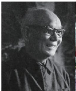
李可染: 中国近代“大场景山水画”国画宗师,“光线渐变画法”开派宗师,他的单幅国画作品《万山红遍》拍到2.93亿元。