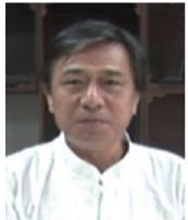
爱新觉罗·启顺: 亲绘《财茂仁和》真迹,规格8平尺,估价2万/幅。

雷甲宝系李可染嫡传弟子、国家一级美术师、国家一级美术师评审委员,其作品屡获国内多个知名美术展金奖。《源远流长山水图》的画风和李可染价值1.24亿的《韶山》那磅礴大气的大场景山水画风如出一辙。