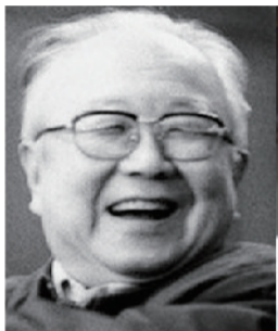
启功: 新中国书法第一人、近代“碑帖书法”第一人,单作《江水万里图》拍到6900万元。