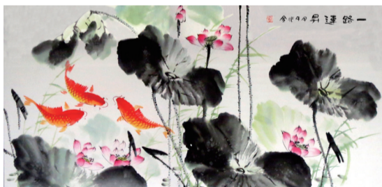
梁兆金: 张大千嫡传弟子亲绘《一路连升·荷花图》真迹,规格8平尺

郑灵海原名郑克俭,系书法大师刘炳森关门弟子,中国华夏书画研究院院士。“鸿运当头”四字,字字展现其恩师刘炳森价值864万的《书法立轴》那种“当代第一隶书”大雅深厚的韵味。