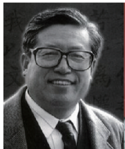
刘炳森: 当代隶书第一人,“刘体隶书”开派宗师,中国书法家协会副主席,中国文联副主席,单幅《书法立轴》拍到864万元。