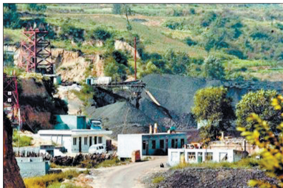
山西省吕梁市中阳县的一座煤矿