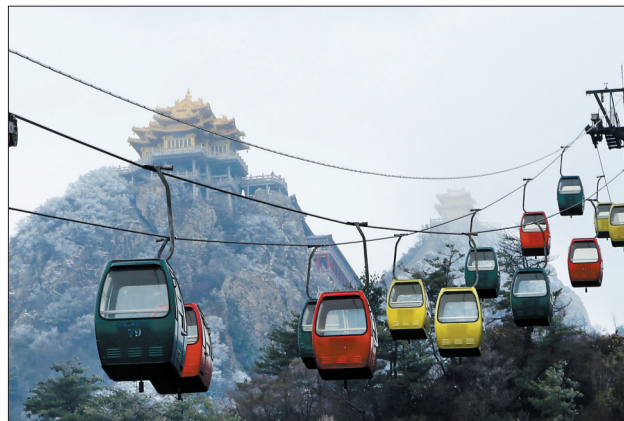
乘坐缆车欣赏雪景,肯定别有一番乐趣