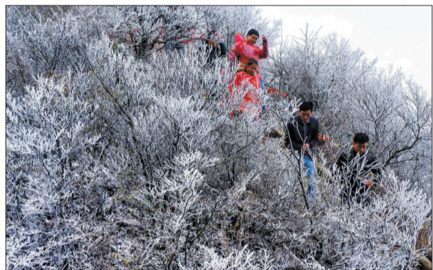
赶上下雪,幸运的登山客不虚此行

7日,我们将迎来立冬。可以说,每一场冷空气,都代表着冬天的脚步更近了。天已经冷了,市民该把冬装拿出来洗洗晒晒,准备过冬吧。