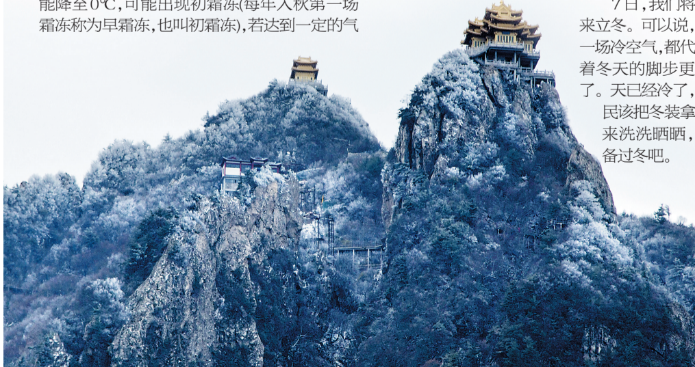
在白雪的映衬下,老君山金顶道教建筑群显得更加恢宏