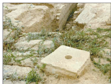
汉魏洛阳故城西阳门遗址

步登北邙阪，遥望洛阳山。洛阳何寂寞，宫室尽烧焚。垣墙皆顿擗，荆棘上参天。不见旧耆老，但睹新少年。侧足无行径，荒畴不复田。游子久不归，不识陌与阡。中野何萧条，千里无人烟。念我平常居，气结不能言。