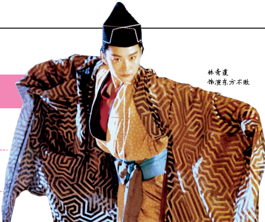
林青霞 饰演东方不败

2014年，林青霞为她的60岁生日，推出第二本书《云去云来》，作为送给自己的生日礼物，书中写的是她迄今60年的人生。