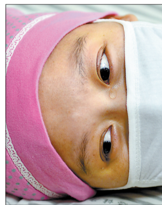
领到证后,喜极而泣