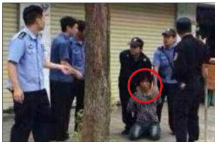
行凶者被控制