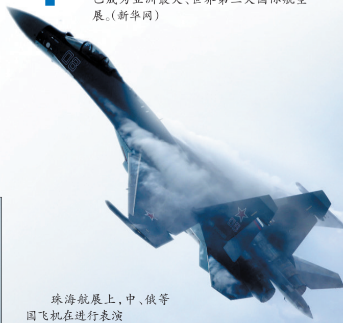
珠海航展上,中、俄等国飞机在进行表演

首届新加坡航展于1981年在新加坡的巴耶利巴举行。1984年的第2届航展迁至樟宜展览中心举行。2014年新加坡航展于2月11日至16日举行,来自全世界47个国家的1000家公司和超过90架飞机参展。经过20多年的发展,该航展已成为亚洲最大、世界第三大国际航空展。(新华网)