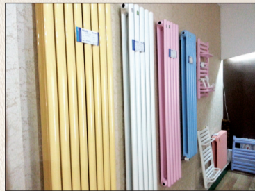
颜色各异的散热器

尤天云表示,虽然现在许多业主都选择地暖,但是如果从经济、实用的角度来说,散热器仍是不错的选择。