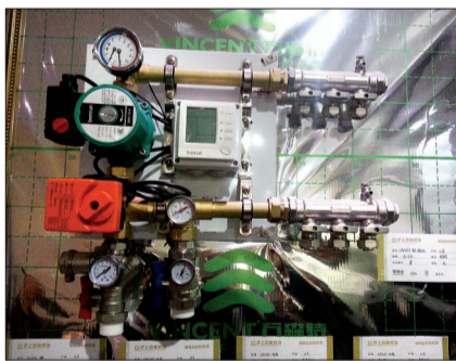
为地暖各路供热管输送热水的分水管

燃气壁挂炉的价格较高,因质量不同,从千元左右到万元价格不等。如果业主选择使用燃气壁挂炉,可以将家中的生活用水与其相连,日常洗澡,冬季刷牙、洗脸,或是刷碗、洗菜,都能随时使用热水,非常实用。