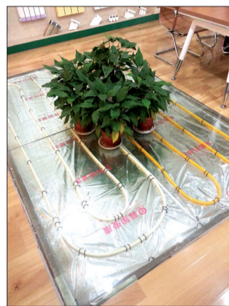
地暖供热管在地板下是这样铺设的