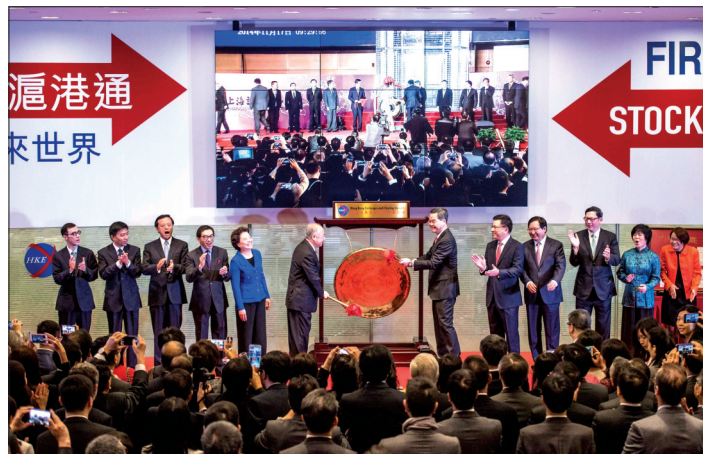
香港特区行政长官梁振英(中右)和香港交易所主席周松岗(中左)在香港交易所一起敲锣,宣布沪港通正式开通

实际上,A股市场成立20多年来,有关上交所、深交所定位等顶层设计问题始终是热议的话题。目前来看,从中小板、创业板推出表明,上交所、深交所、新三板市场定位基本明确,即力求最终建立起类似美国主板市场—全美证券交易所、二板市场—纳斯达克市场等模式。