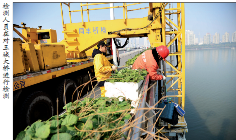
检测人员在对王城大桥进行检测

市区11座桥梁接受专家全面“体检”，预计持续至12月底，日间作业不影响桥面通行，大桥封闭检测时间均在凌晨