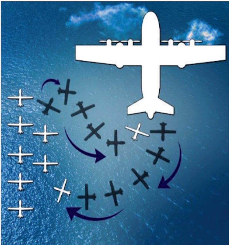
无人机从“飞行航母”上起飞并返回的示意图