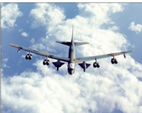
B-52型战略轰炸机携带2架D-21型间谍无人机