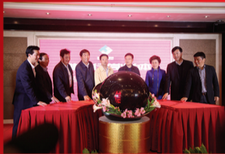
正信互联网金融超市启动仪式