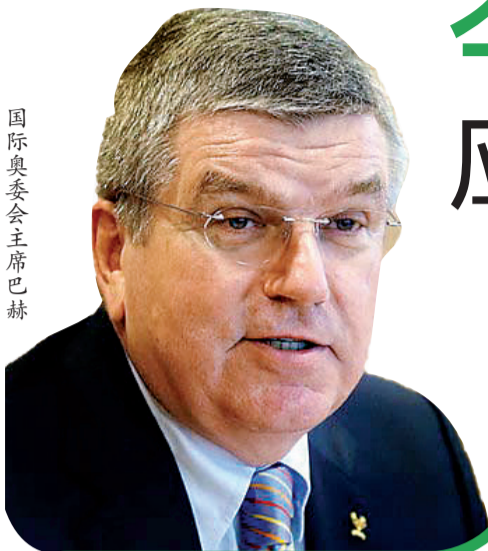
国际奥委会主席巴赫