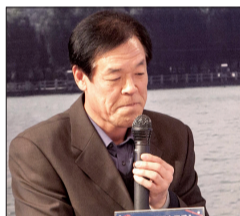
受评嘉宾: 得分这么低,下去得努力