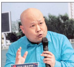
评诺嘉宾: 这么多问题,为啥不解决