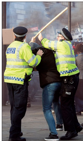
▲ 两名警察试图夺下一名示威者手中的木棍 ▲ 示威者在拆除警方设置的路障