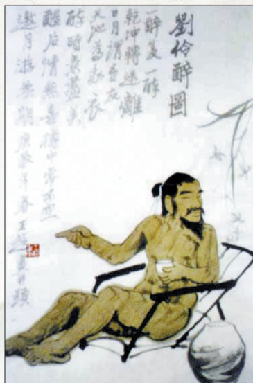
刘伶醉图 (资料图片)

刘妻以为刘伶是认真的,就高高兴兴地照他说的去做了。一切准备妥当后,刘伶对老婆说祭神时旁边不能有人,刘妻信以为真,转身走了。她一走,刘伶马上跪下,道:“天生刘伶,以酒为名。一饮一斛,五斗解醒(chéng,意为喝醉了神志不清)。妇儿之言,慎不可听。哈哈!”说完刘伶大喝起来,刘妻气得差点儿晕过去。