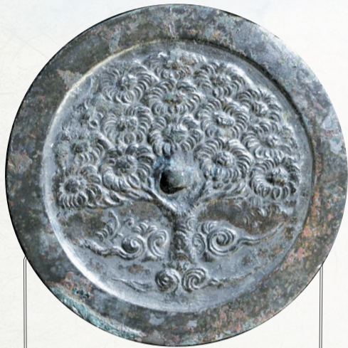
名称: 娑罗树镜 年代: 北宋 形状: 圆形, 直径14厘米, 重214克 出土地点: 洛阳