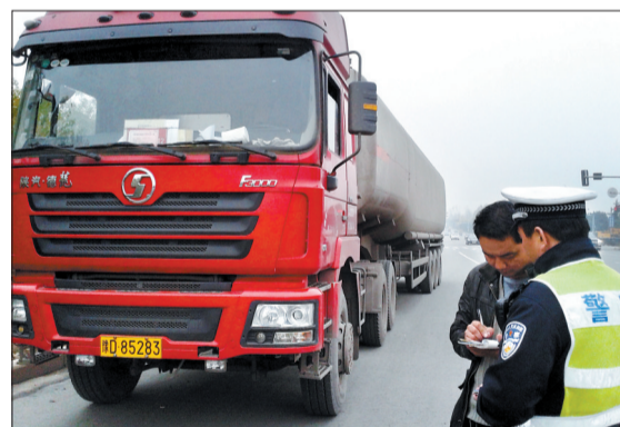
胡某在处罚记录上签字