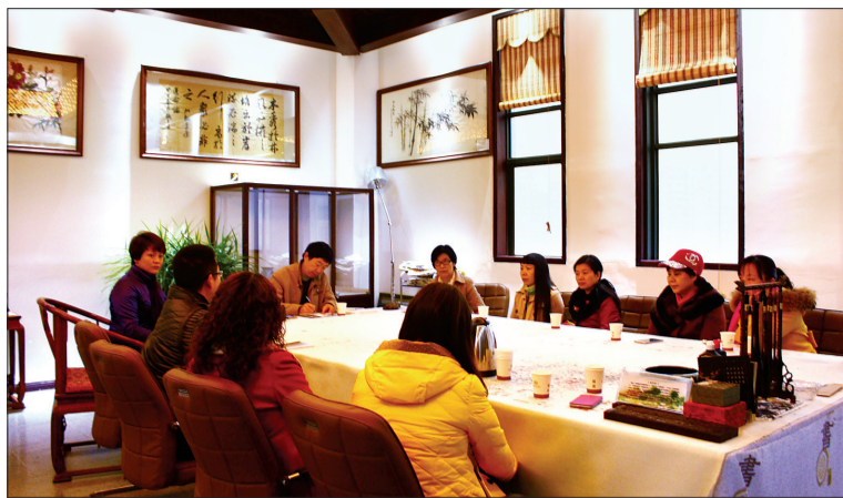
读书会现场