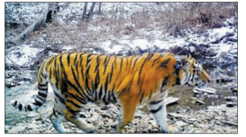
普京放生的老虎