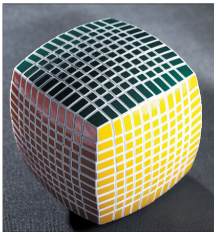
▼“魔方博物馆”里造型各异的魔方