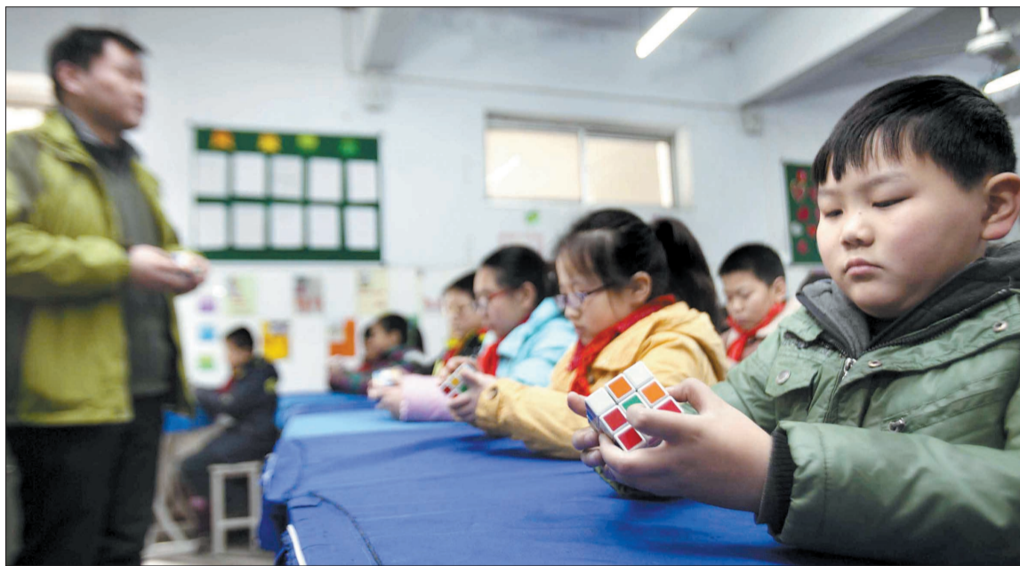
学生们在老师的指导下学习魔方玩法

一个学校涌现这么多魔方高手，这和学校的培养氛围密不可分。位于老城区的市直一小是名副其实的“魔方学校”，魔方课在该校是被列入课程表的特色课，而且，该校还有个“魔方博物馆”，为学生呈现一个精彩的魔方世界。