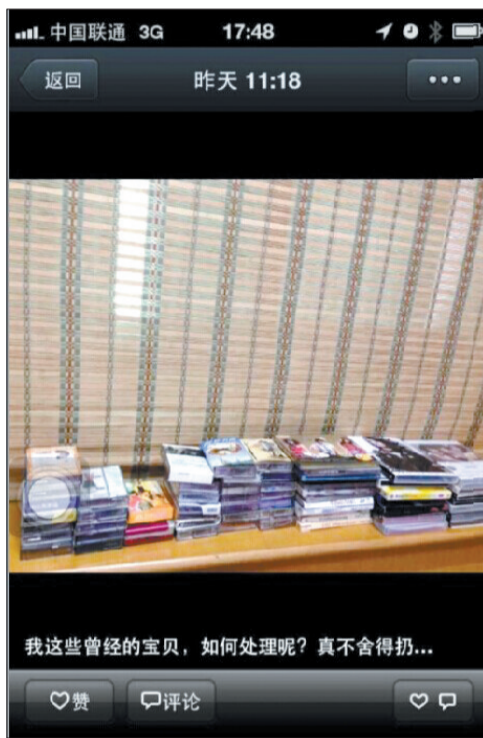
市民在朋友圈晒不知如何处置的旧磁带和碟子 (网络截图)

洛阳晚报记者走访市场后发现,由于磁带内容长度不同,一盘磁带转成音频文件或光盘的市场价为30元至100元不等,一般按小时收费。林老板提醒,建议不擅长电脑软件操作及对转换后的音频质量要求较高者,找专业人士操作,赛易博电脑城、世纪电脑城均有商家可提供此服务。