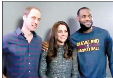
詹姆斯(右一)与威廉王子和凯特王妃合影(视频截图)