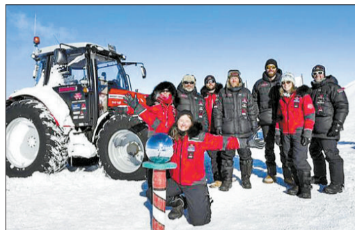
奥塞福特与同行的7人抵达南极点