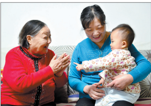
马金凤和家人在一起