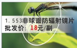
1.553非球面防辐射镜片 批发价: 18元/副