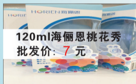
120ml海俪恩桃花秀 批发价: 7元