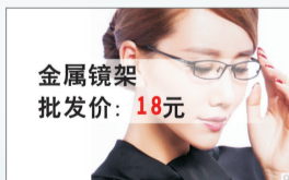
金属镜架 批发价: 18元