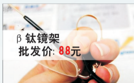
β钛镜架 批发价: 88元