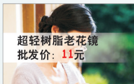
超轻树脂老花镜 批发价: 11元