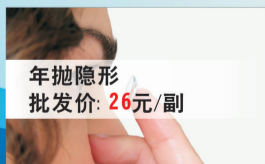
年抛隐形 批发价: 26元/副