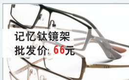
记忆钛镜架 批发价: 66元