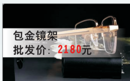
包金镜架 批发价: 2180元