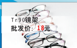
Tr90镜架 批发价: 18元