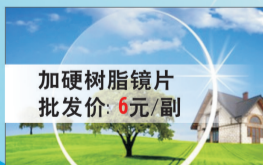
加硬树脂镜片 批发价: 6元/副