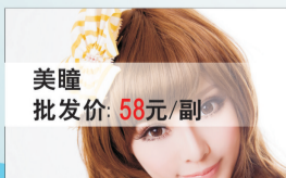
美瞳 批发价: 58元/副