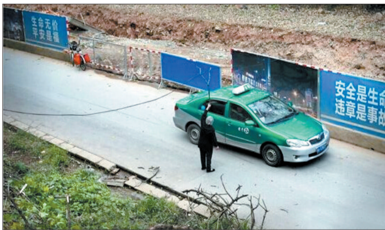
大妈用树杈高举电线