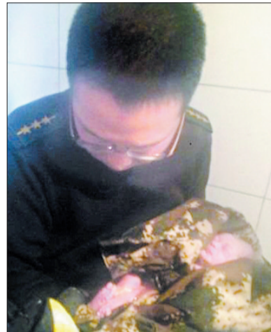
用军装包住孩子紧急送医