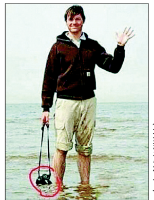
一会儿你就笑不出来了