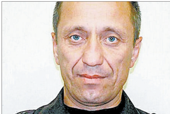
米哈伊尔·波普科夫