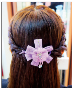
编发款式:心形半披肩发

14日下午,小记与一位想给女儿扎头发的老爸一同来到了洛阳王府井百货,向流行美饰品专柜的达人请教了小萌娃编发秘诀。